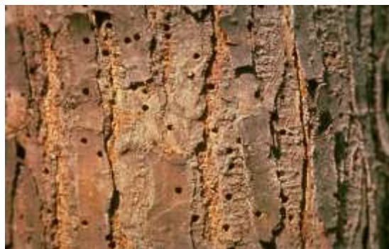
سوراخهای نمایان شده روی پوست درخت نارون توسط سوسکه‌های بالغ (راست) لاروهای سوسک اروپایی نارون در پوست درخت نارون (چپ)