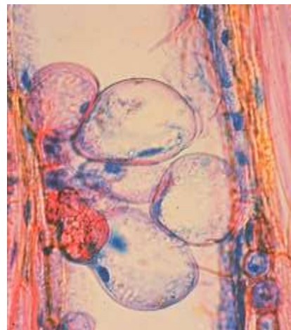
برش طولی از آوندهای نارون مسدود شده با تیلوزهای بزرگ